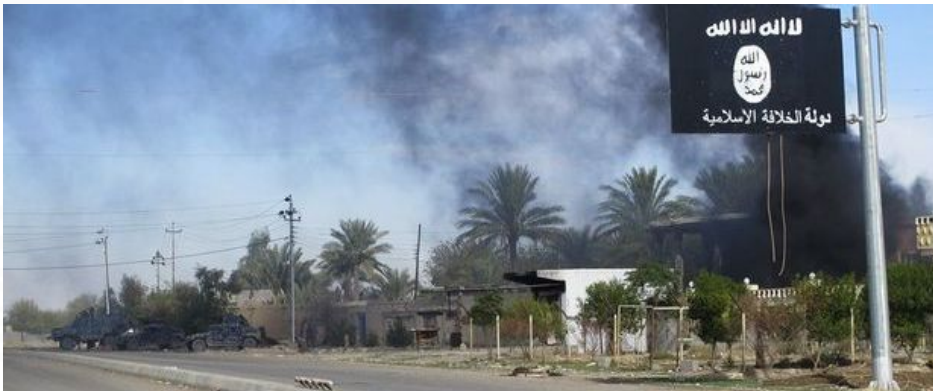
IS-vlag na gevechten in Irak

Beke, Buma, Michel en co zijn niet meteen politici die zich in het verleden erg bezorgd hebben getoond over Syrië. Het valt te betwijfelen ook of beide heren veel kaas hebben gegeten van de complexiteit van het conflict of dat ze de gevolgen van een militair ingrijpen kunnen inschatten. De regio is ontzettend vatbaar voor escalatie, zoals we al konden zien in Libanon. Nu de oorlog zich, na jaren van passiviteit, plots in de vorm van een vluchtelingen crisis in onze eigen contreien laat zien, komen de geïmproviseerde pleidooien en schijnoplossingen.