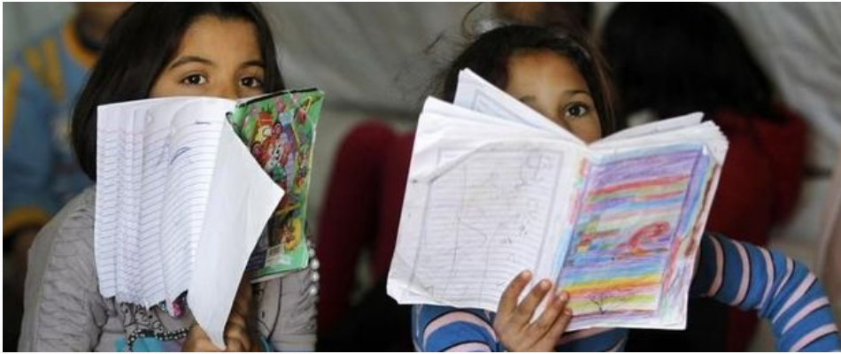
Syrische meisjes leren lezen in Amman, Jordanië

13.7 miljoen kinderen veertig percent van de schoolplichtige kinderen - in Syrië, Irak, Libië, Soedan en Jemen kunnen momenteel niet naar school gaan. Wereldwijd zitten 34 miljoen kinderen in conflictgebieden niet op de schoolbanken. Het risico op een "verloren generatie" die vatbaar is voor extremisme en geweld is reëel. Humanitaire hulp blijft in de eerste plaats een morele en ethische kwestie, maar dient dus ook onze veiligheid en eigenbelang.