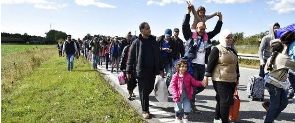
Een groep Syrische vluchtelingen, op weg naar Zweden

Het actief promoten van een vredesagenda en veiligheidsstrategie die een sterke nadruk legt op conflictpreventie en vredesopbouw is meer dan ooit nodig. Vrede, veiligheid en ontwikkeling zijn onlosmakelijk met elkaar verbonden. Conflictpreventie is vele malen goedkoper dan een reactief beleid.