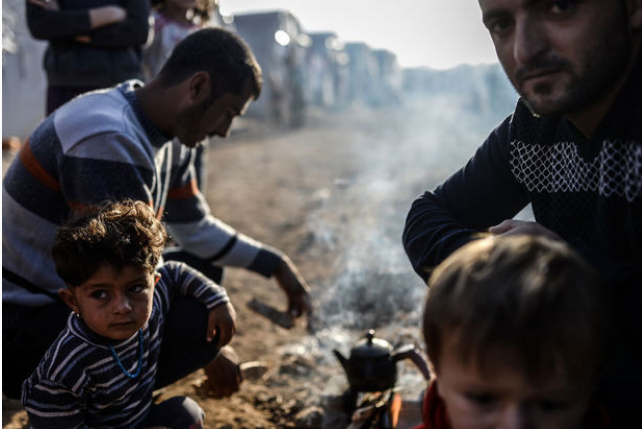
Vluchtelingen aan de Turks-Syrische grens

In zijn eerste bijdrage voor het Schaduwparlement pleit Saïd El Khadraoui (SP.A) voor een meer Europese aanpak voor migratie. 'Een VN-resolutie en luchtaanvallen zijn niet voldoende om een dictatuur om te vormen tot een democratie.'