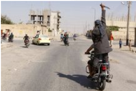
IS-strijder viert een overwinning in de buurt van Raqqa

Assad is echter wel een machtsfactor en het enige garantieticket voor Alawitische en christelijke minderheden, die een radicale machtsovername door de soennitische meerderheid vrezen. De democratische oppositie - die toch heel actief was voor de militaire escalatie van het conflict - kan zo terug op het toneel verschijnen, als er ernstige diplomatieke inspanningen worden geleverd op internationaal niveau. Onze politici kunnen verder maatregelen nemen die de economie viseren die aan deze oorlog vast hangt. Er is een heel arsenaal aan alternatieven, maar dat vergt wil, de nodige creativiteit, internationale samenwerking en vooral ook een minder gemilitariseerd denken.